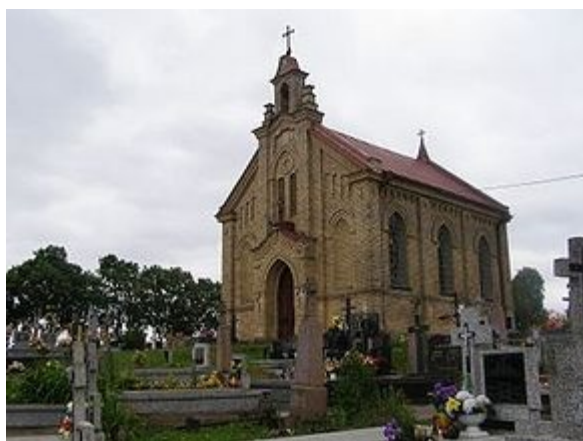
Zdjęcie 4. Kaplica cmentarna św. Ducha 1907 14

Turyści odwiedzający Gminę Goniądz mogą pospacerować starymi alejami miejscowego cmentarza i odszukać żeliwne, odlewane w sztabińskiej hucie – krzyże, jak też wejść do kaplicy cmentarnej św. Ducha z 1907 roku.