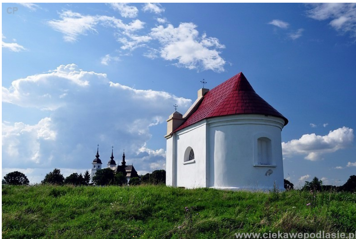
Zdjęcie 3. Kapliczka pod wezwaniem św. Floriana z 1864 r. 13

Turyści odwiedzający Gminę Goniądz mogą pospacerować starymi alejami miejscowego cmentarza i odszukać żeliwne, odlewane w sztabińskiej hucie – krzyże, jak też wejść do kaplicy cmentarnej św. Ducha z 1907 roku.