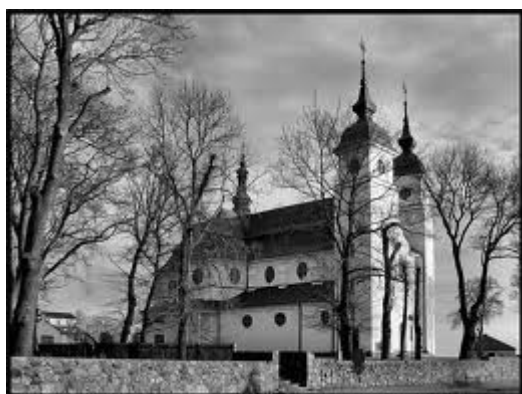
Zdjęcie 2. Kościół p.w. św. Agnieszki w Goniądzu

Na terenie gminy znajduje się wiele godnych poznania, cennych zabytków kultury sakralnej. W Goniądzu warty obejrzenia jest neobarokowy kościół zbudowany w latach 1922-24, zaprojektowany przez Oskara Sosnowskiego.